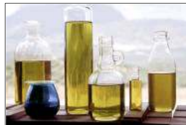
El protagonista de los platos participantes será el aceite de oliva